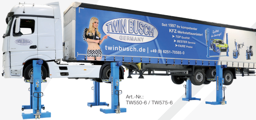
Art.-Nr.: TW550-6 / TW575-6

Die 4er-Ausführung ist jederzeit auf eine 6er-Ausführung aufrüstbar. Die Hauptsäule verfügt generell über 6 Anschlüsse.