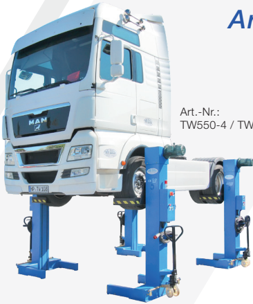
Art.-Nr.: TW550-4 / TW575-4

Die 4er-Ausführung ist jederzeit auf eine 6er-Ausführung aufrüstbar. Die Hauptsäule verfügt generell über 6 Anschlüsse.