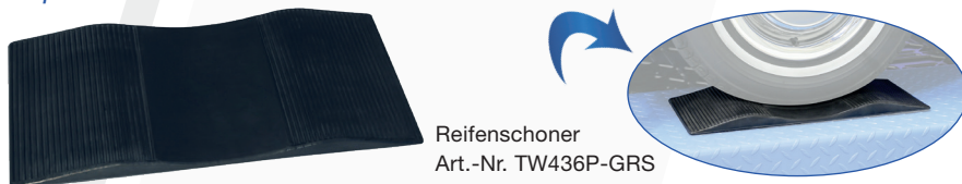
Reifenschoner Art.-Nr. TW436P-GRS

Weiteres Zubehör finden Sie unter www.twinbusch.de