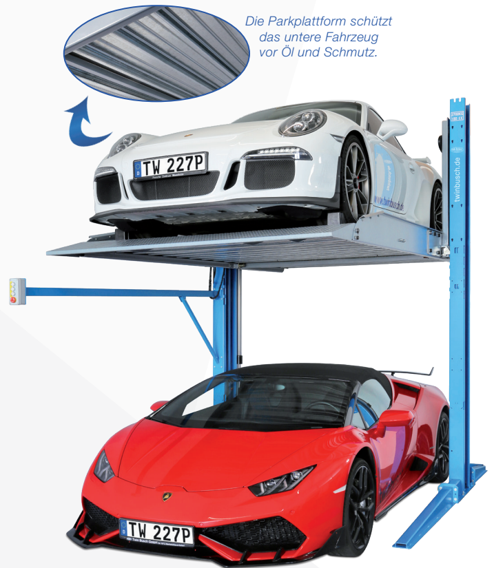
Die Parkplattform schützt das untere Fahrzeug vor Öl und Schmutz.